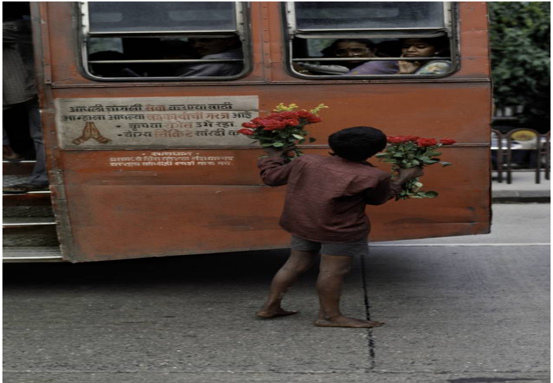
Young Boy selling flowers India, 1993